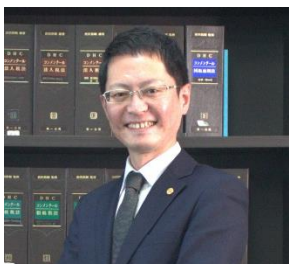
税理士法人芦田合同会計事務所 行政書士

確定申告書一式のコピーをご持参いただければ、後日無料で医療法人化した場合の節税額をシミュレーションさせていただきます。